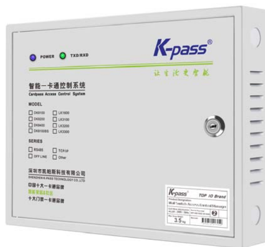
室内普通控制器机箱