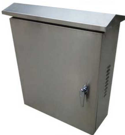
室外 304 不锈钢防水机箱